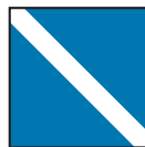
Ende Verbot und Gebot