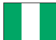
Erlaubnis zur Durchfahrt