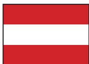
Verbot der Durchfahrt